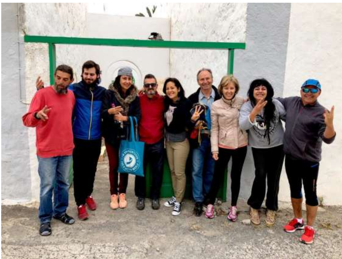
El saludo del 3 con los dedos, simbolizando el nivel Tseek, e invitándonos hermanadamente a reconocernos con el 33, a las puertas del Muulasterio Tseyor Tegoyo-Lanzarote Convivencias 2019

En la mañana y la tarde de hoy, miércoles, hemos estado escuchando y comentando el comunicado dado ayer por Rasbek, al final de los comentarios, Rasbek se ha brindado a contestar nuestras dudas.