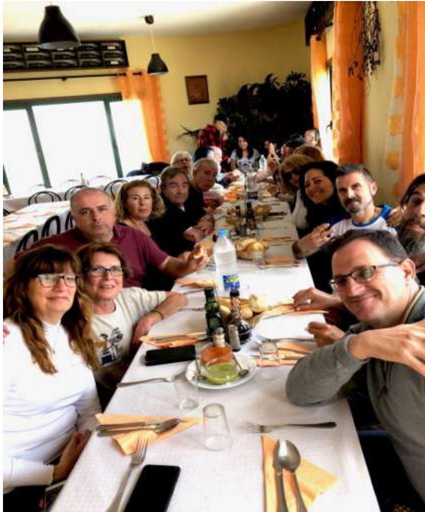
Reponiendo energías por medio del método tradicional. Convivencias Muulasterio Tseyor Tegoyo. Lanzarote. Mayo 2019

Por la tarde y la noche de hoy, hemos estado escuchando y comentando el comunicado recibido hoy (972) de Shilcars, al final de la mañana. Tras algunas reflexiones del grupo sobre la situación actual del planeta y de su humanidad, Aumnor nos ha dado el siguiente comunicado.