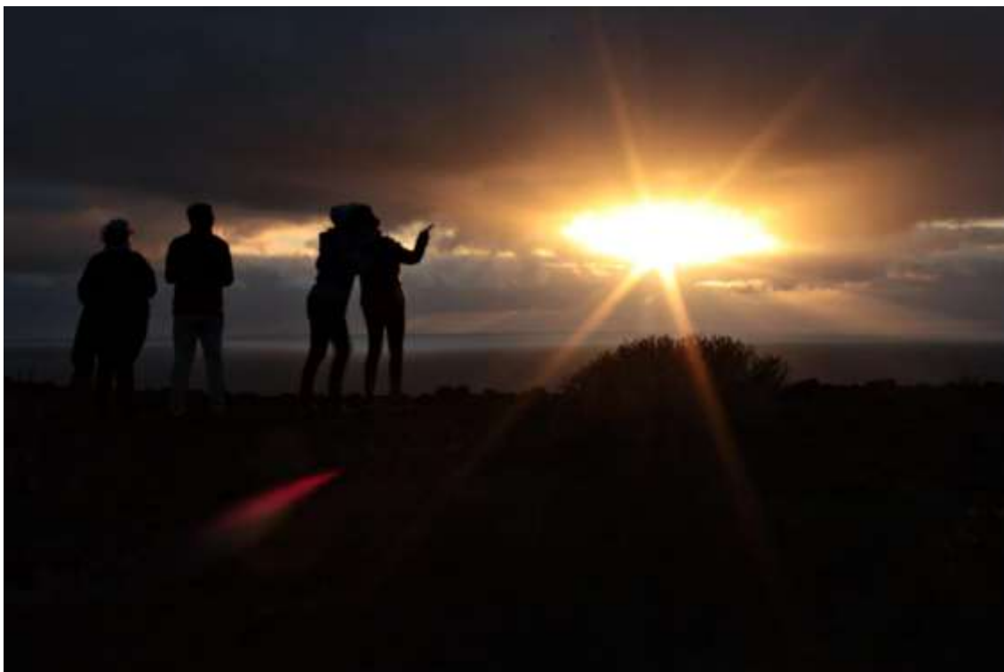
Cae la tarde en la cumbre del Volcán de la Abducción. Convivencias Muulasterio Tseyor Tegoyo. Lanzarote. Mayo, 2019.

Hoy han comenzado las convivencias en el Muulasterio Tseyor Tegoyo. El tema de la mañana ha sido Pueblo Tseyor. Cada uno de los presentes, 30 personas en total hoy, ha dado sus impresiones y visiones de cómo entiende Pueblo Tseyor en el momento presente. También se han comentado experiencias de avistamiento de naves y contacto con los hermanos del cosmos. Al final de la mañana, Shilcars nos ha dado el siguiente comunicado.