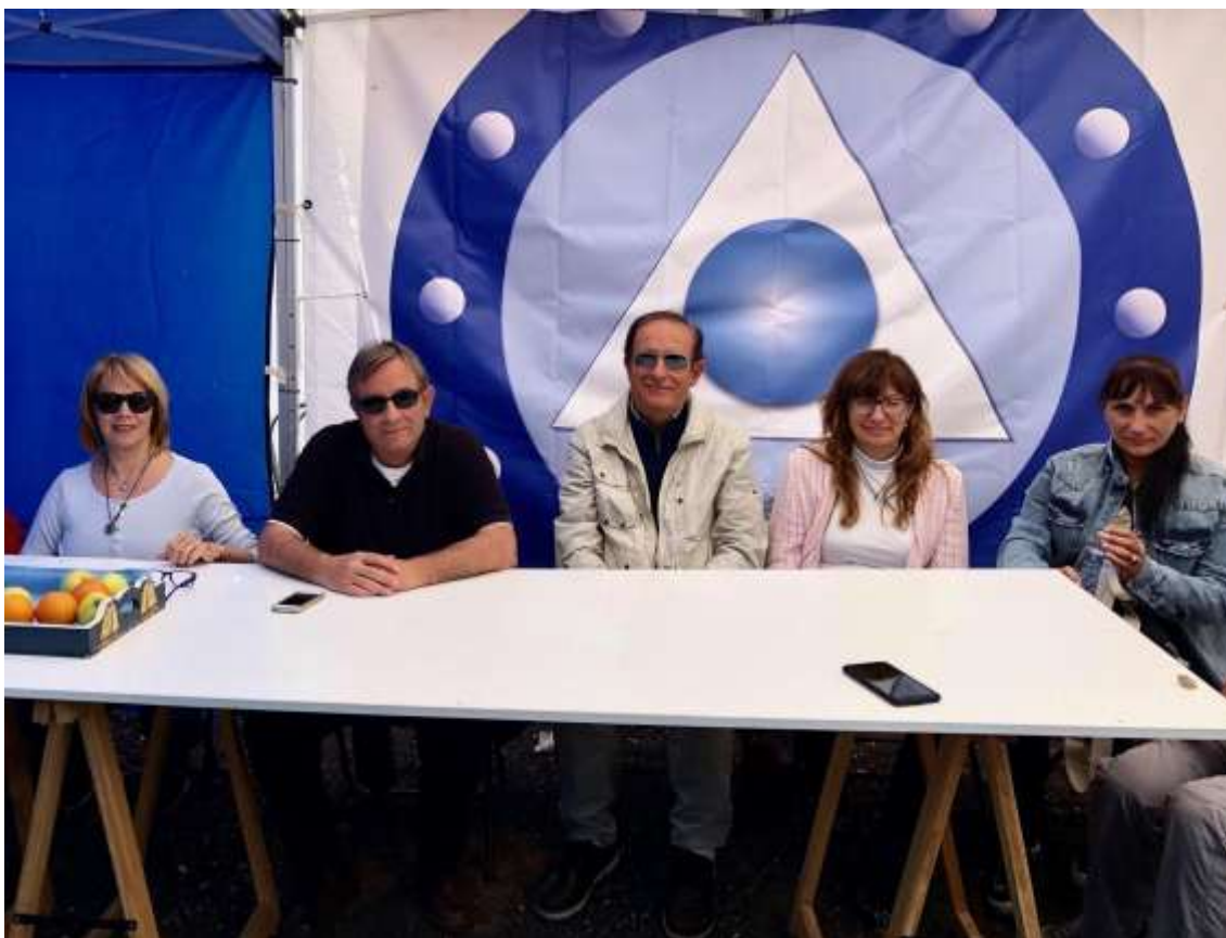
Bajo la carpa del jardín: Sala, Puente, Castaño, No te Olvides La Pm, y Aún es pronto La Pm

En la mañana de hoy martes, hemos estado escuchando y comentando el comunicado 973, dado ayer por Aumnor. Una vez comentado y habiendo quedado varias dudas, Aumnor se brindó a contestar preguntas sobre las dudas que habían surgido.