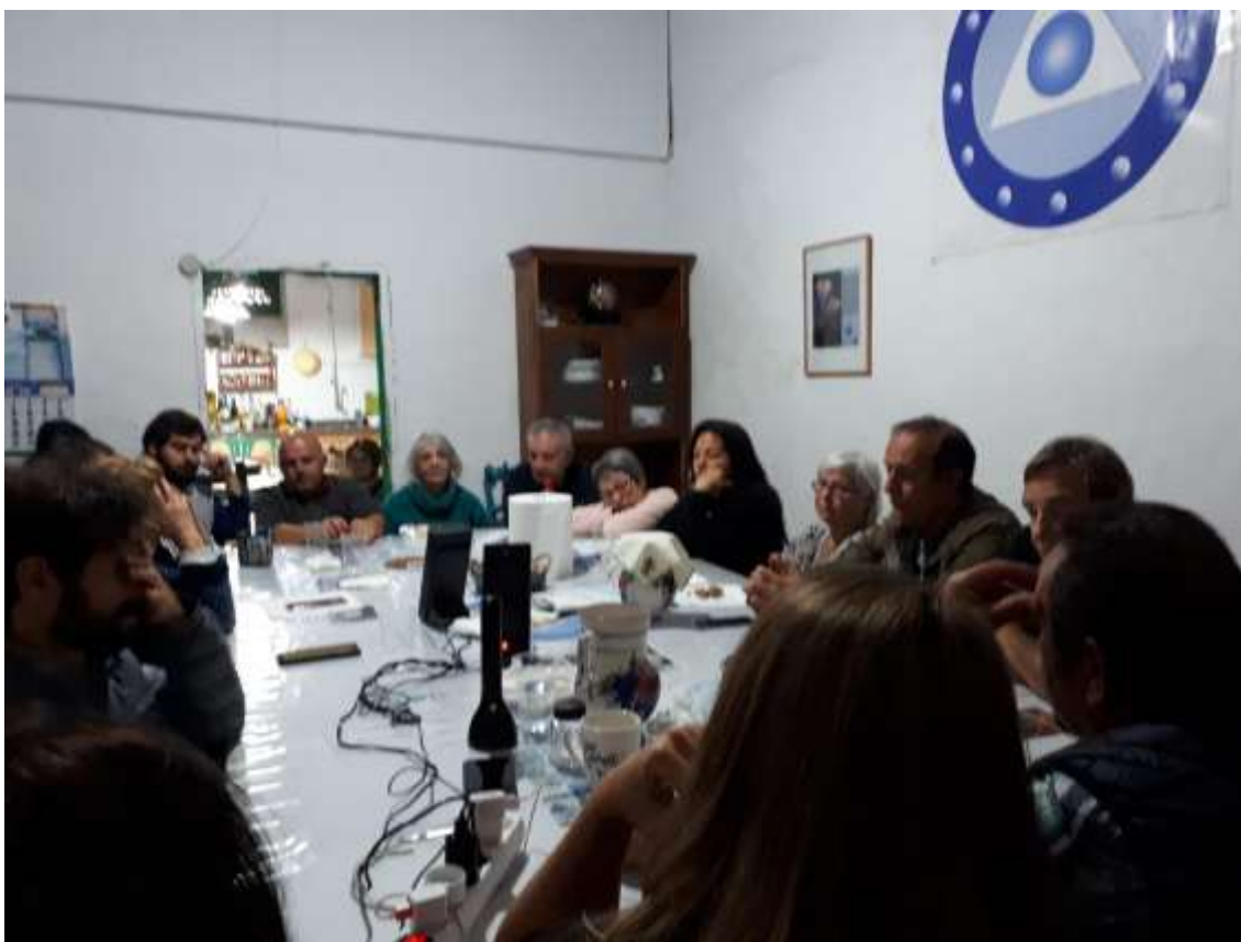
Muulasterio Tseyor Tegoyo. Lanzarote-Islas Canarias. Convivencias Mayo 2019

En la noche de hoy miércoles, después de la cena, tras comentar diversas experiencias de contacto con naves y guías estelares, Shilcars nos dio el siguiente comunicado.